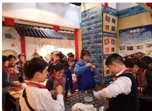
(闵行青少年活动中心)

原文链接： http://www.ghcollege.ecnu.edu.cn/58/bb/c8613a219323/page.htm