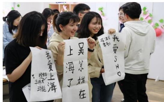
中华传统文化体验

原文链接： http://www.ghcollege.ecnu.edu.cn/60/1a/c8608a221210/page.htm