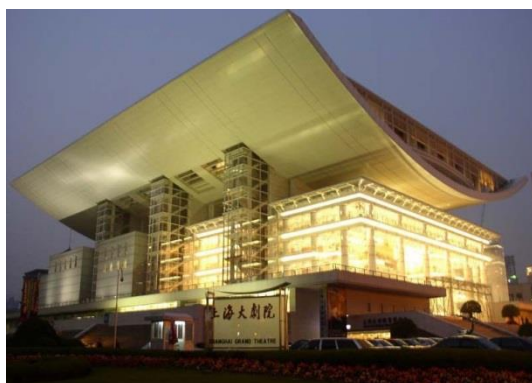
(上海大剧院做引导者)